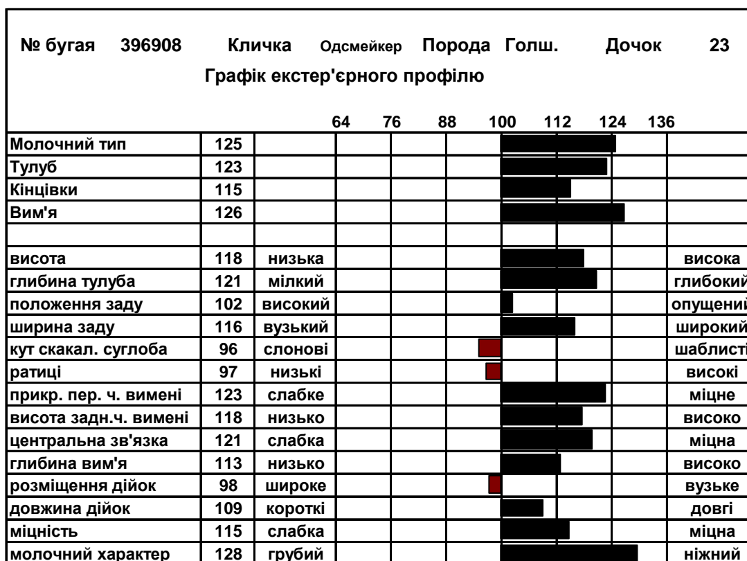
Рис. 3. Графік екстер'єрного профілю дочок бугая Одсмейкера 396908

низький рівень розвитку ознак, що характеризують екстер'єрний тип тварин молочної худоби, про що також наглядно свідчить графік екстер'єрного профілю його дочок, рис. 4.