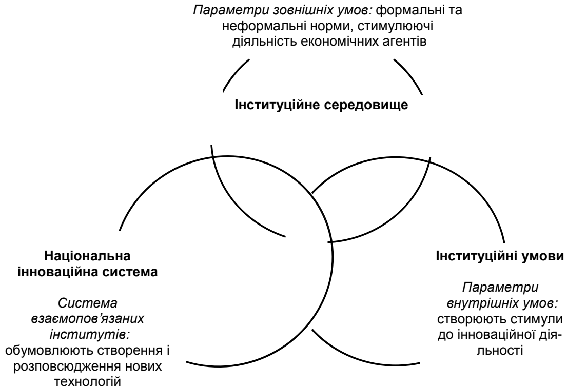
Рис.2. Двигуни інноваційних процесів в економіці

Інституційне середовище визначає стимули до здійснення інноваційної діяльності, формує сприятливі умови для розробки і впровадження нових технологій, підвищення підприємницької активності. В цьому сенсі взаємозв'язок між інституційним середовищем на макрорівні, інституційними умовами та національною інноваційною системою можна представити у вигляді коліщат, які рухають інноваційні процеси в економіці (рис. 2.)