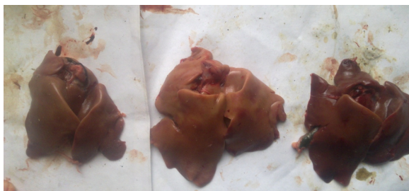
Рис. 2. Патологічні зміни печінки (зліва направо): мікотоксини; мікотоксини + патогени; мікотоксини + патогени + пребіотик + адсорбент мікотоксинів.

При патологоанатомічному дослідженні у інфікованої птиці, що одержувала контамінований мікотоксинами корм, встановили ураження печінки з ознаками гепатиту, крововиливи на печінці, зернисту дистрофію печінки; запалення брижових лімфовузлів; катаральний гастроентерит (рис.2). При розтині бройлерів, які отримували окремо контамінований корм або інфікованих патогенами, подібних змін не виявляли.