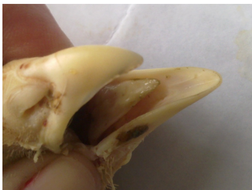
Рис. 1. Некротичні ураження ротової порожнини бройлерів при контамінації кормів мікотоксинами і інфікуванні патогенами.

нований мікотоксинами корм та була інфікована низькими дозами патогенів (Рис 1). У птиці, що одержувала контрольний раціон та була інфікована низькими дозами патогенів, змін загального стану та клінічного прояву захворювань не спостерігали.