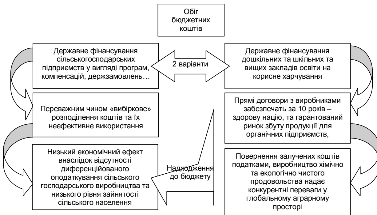
Рис. 2. Розробка альтернативного напрямку стимулювання органічного агровиробництва

Проведене дослідження ринкового аграрного сектору дозволило визначити орієнтири реалізації стратегії зростання сучасного агробізнесу: