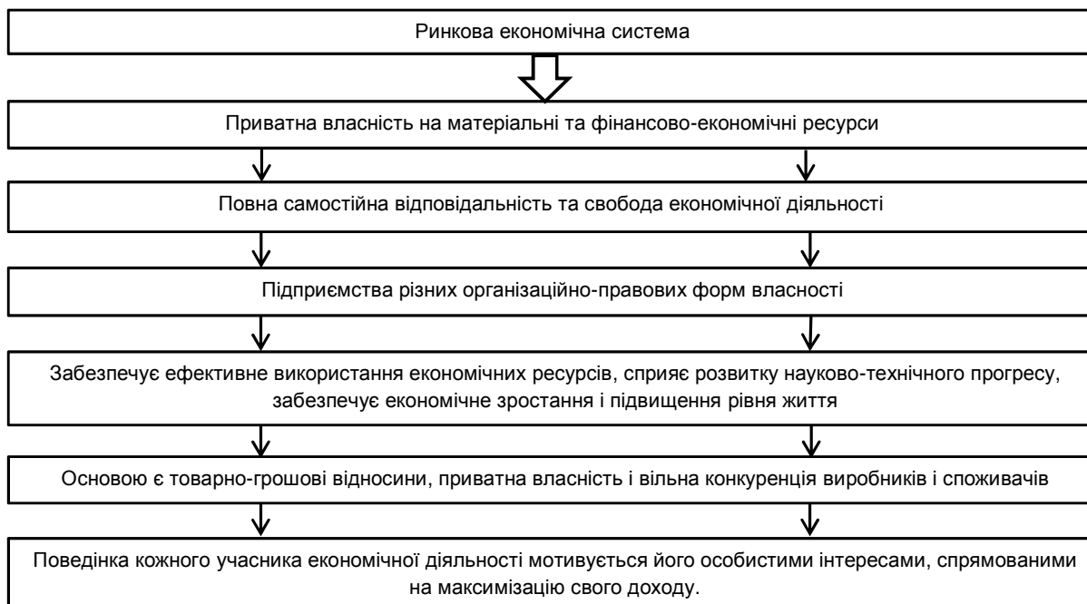
Рис. 3. Схематична модель ринкової економічної системи

* власні дослідження у відповідності до [4]