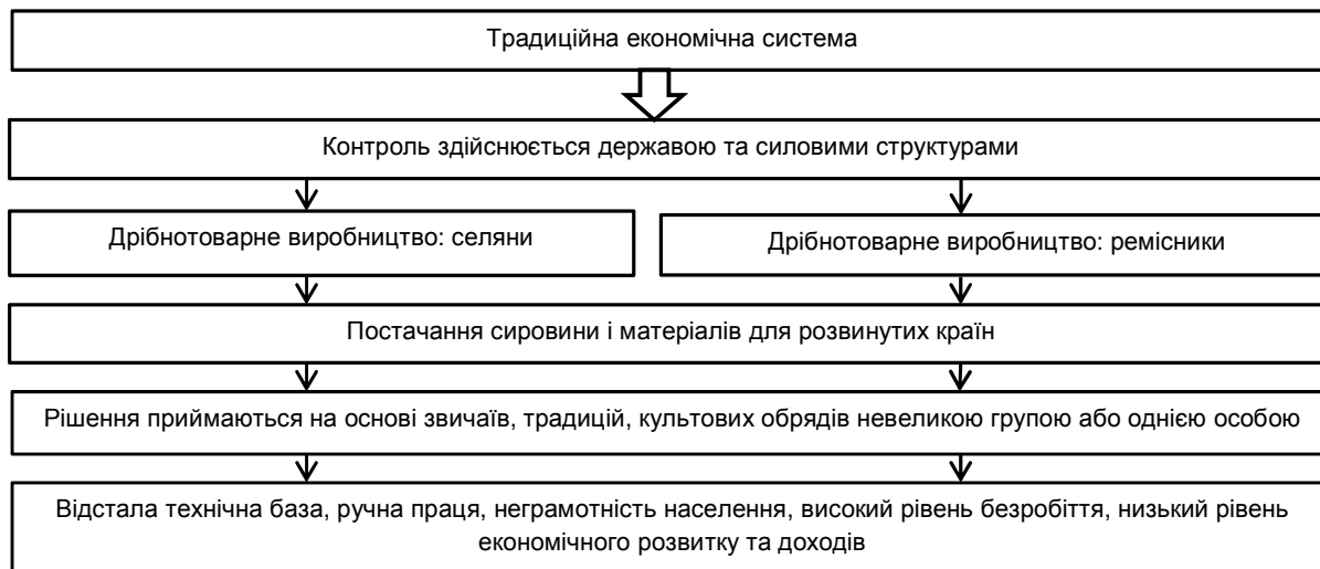
Рис. 1. Схематична модель традиційної економічної системи

Традиційною економічною системою є економіка, в якій практичне використання ресурсів визначається традиціями та звичаями, їй притаманні певні ознаки. На рис. 1. зображена схематична модель устрою традиційної економічної системи. В ній, як правило, переважає сільсько-господарське виробництво. Технічний прогрес обмежується наявними традиціями та звичаями. Велику роль відіграє іноземний капітал. Зазвичай країни традиційної економіки є постачальниками сировини і матеріалів для розвинутих країн і виступають ринками збуту готової продукції останніх, тобто є аграрно-сировинним додатком колишніх своїх метрополій.