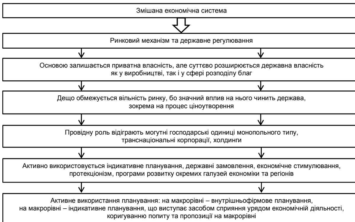
Рис. 4. Схематична модель змішаної економічної системи

* власні дослідження у відповідності до [4]