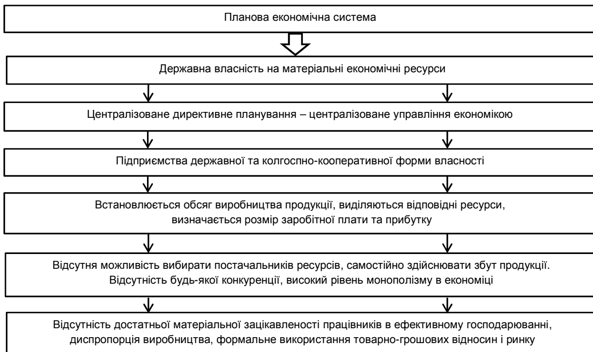
Рис. 2. Схематична модель планової (командної) економічної системи

* власні дослідження у відповідності до [4]