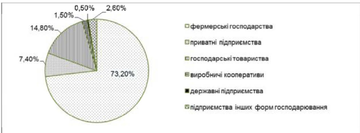
Рис. 2. Структура діючих сільськогосподарських підприємств за організаційно-правовими формами господарювання [6].

форм господарювання. Рисунок 2 демонструє значущість місця фермерських господарств в організаційній структурі аграрного бізнесу [6].