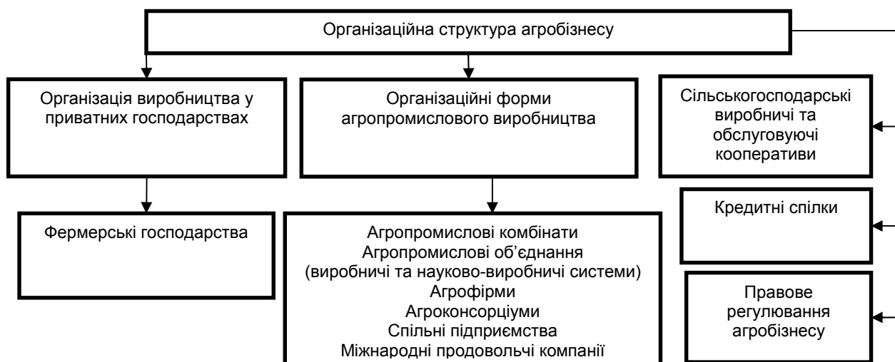
Рис.4. Організаційна структура агробізнесу. [4, с.49-56]

значній мірі формується завдяки атмосфері взаєморозуміння і розподілу праці всередині колективу і досягається з допомогою високого рівня мотивації та відповідальності працівників, можливості брати участь у прийнятті управлінських рішень. На рис.4 зображено місце фермерських господарств в організаційній структурі агробізнесу.