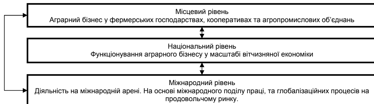
Рис. 1. Рівні функціонування аграрного бізнесу.

І.Ю.Сіваченко в агробізнесі, виокремлює три рівні його функціонування. На практиці усі рівні є тісно взаємопов'язані (рис.1) [1].