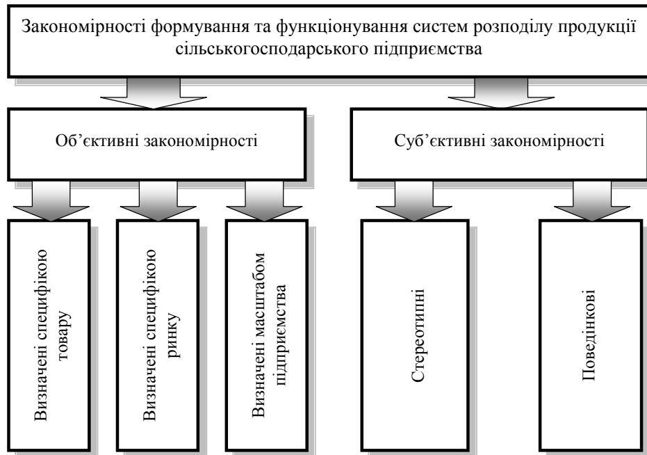
Рис. 3. Класифікація закономірностей формування та функціонування систем розподілу продукції аграрних підприємств

кою товару, ринку та масштабом підприємства. До вказаної групи закономірностей відноситься, зокрема, скорочення довжини каналів розподілу на об'єктових ринках товарів сільськогосподарського походження, які характеризуються нетривалим строком зберігання між моментом виробництва та переробки. Такими товарами є молоко, цукрові буряки, окремі види м'ясної сировини тощо.