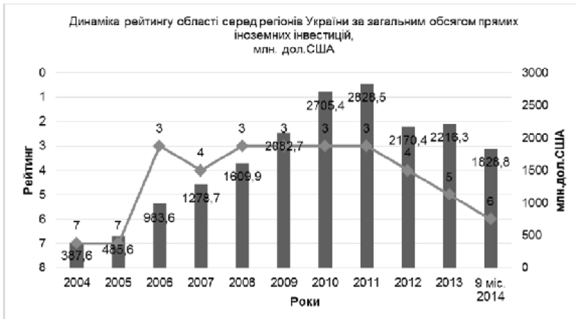
Рис. 2. Динаміка рейтингу області серед регіонів України за загальним обсягом прямих іноземних інвестицій [10]

Статистичне скорочення обсягів прямих іноземних інвестицій на 14,2% у порівнянні з початком 2014 року відбулось, передусім, унаслідок зміни вартості акціонерного капіталу нерезидентів, а саме через курсову різницю: 317,4 млн дол. США (рис. 2).