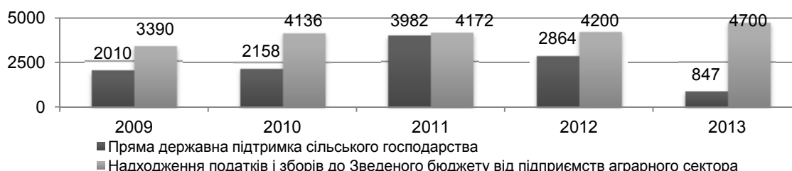
Рис. 1. Співставлення прямої державної підтримки сільського господарства України з обсягами надходження коштів від підприємств галузі до Зведеного бюджету, млн. грн.*

ся у вигляді кредитних і податкових пільг, цінового регулювання, але її дієвості підприємства не відчули. На реальну підтримку могла розраховувати хіба що обмежена група осіб, інтереси яких і любіювала влада. В більш-менш сприятливому 2013 р. обсяги прямої бюджетної підтримки галузі скоротилася в 2,4 рази та становила 847 млн. грн., і це при тому, що її ВДВ у зазначений період переросла позначку в 250 млрд. грн., а обсяги надходжень податків і зборів до Зведеного бюджету від сільськогосподарських підприємств сягнули 47 млрд. грн. (рис. 1).