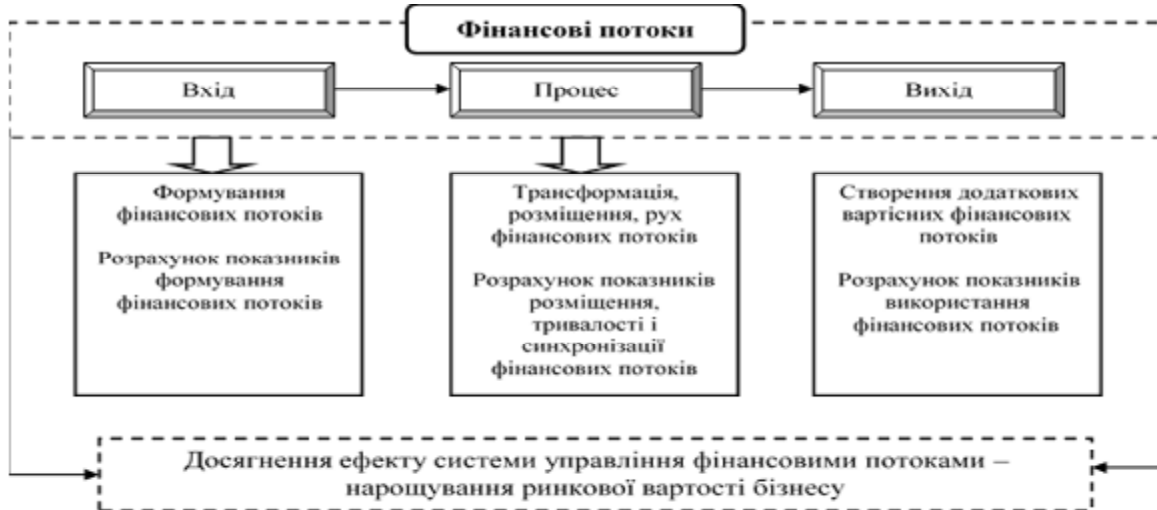
Рис. 2. Схема визначення рівня ефективності розміщення і використання фінансових потоків підприємства

управління економічною системою концентрує свій функціональний зміст в цілеспрямованій зміні стану системи, яка пов'язана із дією всього процесу – ефекті. Ефект від процесу управління фінансовими ресурсами, зокрема, в частині їх розміщення і використання, проявляється в здатності фінансових потоків генерувати додаткові вартісні потоки та нарощувати вартість самого підприємства (рис. 2).